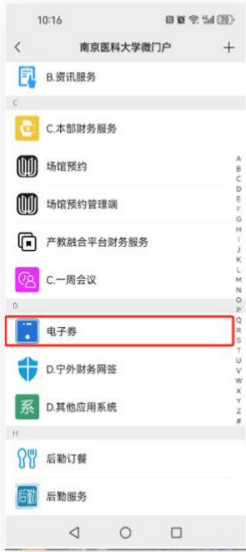
在南医微门户点击电子券进入页面