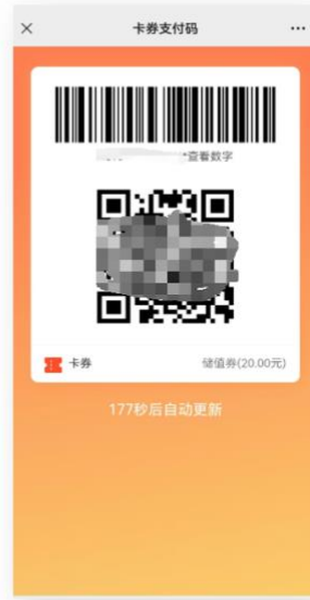
在食堂消费机上扫二维码即可使用电子券 (消费金额小于发放金额时，可多次使用)