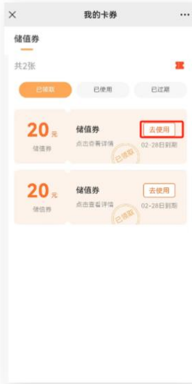
我的卡券页面可查看已收到的电子券， 击电子券的去使用，进入使用页面